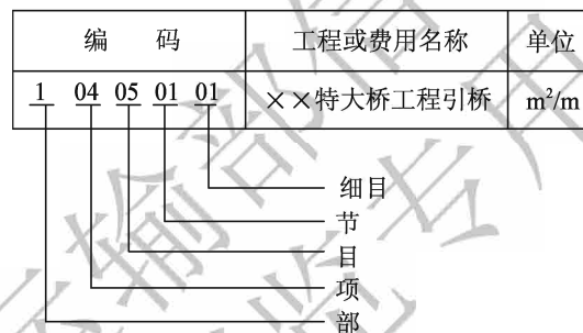
图 4.2.3 要素费用项目编码示意图

3 要素费用项目的工程内容，依照公路工程常规、通用的设计部位及费用内容划分确定，并实现编码、名称、统计单位与工程内容相对应。