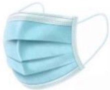
挂耳式医用外科口罩