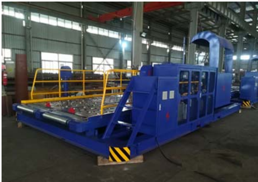
图 3 产品实物图示