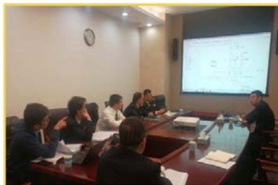
东部LNG港区海事工作船码头工可内审