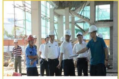
船舶溢油应急设备库工程交工验收