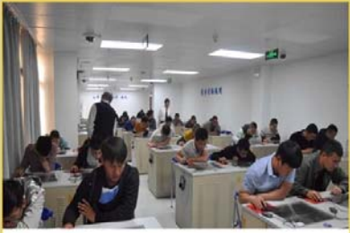
船员考试系统升级改造