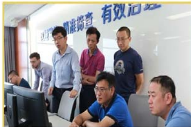
VTS系统改扩建二期工程交付使用