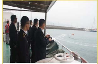
智能遥控救生器投入使用

四是强化涉企收费等基础信息公开。为贯彻落实上级信息化发展规划和海事信息系统顶层设计要求，深圳海事局首次制定并发布《深圳海事局信息化发展规划》，对未来一段时期信息化发展和建设进行总体规划。对照交通运输部失效法规，完成对 46 条已废止、失效的政策性文件作出明确标注，并通过政策法规废止信息子栏目进行公开。按照广东省、深圳市相关部门的通知要求，清理规范涉企收费，落实收费目录清单制度，进一步做好收费目录清单及收费依据公示工作。提前通知船舶车船税纳税人及时做好年度车船税申报工作，避免跨年产生滞纳金，同时积极探索区块链票据在船舶车船税代征工作中的应用。及时更新公布辖区港口建设费委托代收单位名单，强化社会监督，规范代收工作管理。部署实施海事规费征稽管理平台三期系统，弃土外运经营