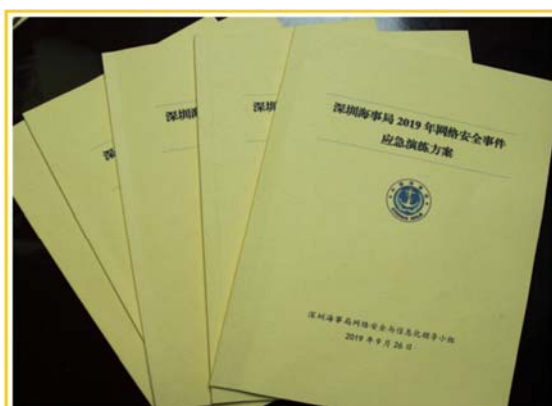
深圳海事局2019年网络安全事件应急演练方案

二是加强网络安全防护，为信息公开安全提供有力保障。编制并印发《深圳海事局网络安全管理办法》，规范网络安全工作，全面落实网络安全管理责任制；配套出台实施《深圳海事局网络安全事件应急预案》，为网络安全事件应急处置提供重要依据。全面开展网络安全测评、渗透测试、漏洞扫描、代码审计及评估工作，开展首次网络安全应急演练，提高网络安全应急处置能力；做好重要时段的网络安全值守工作，全年未发生任何责任型网络安全事故。