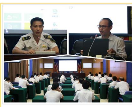
2019年度信息化知识更新培训暨新版外网网站功能测试培训动员会