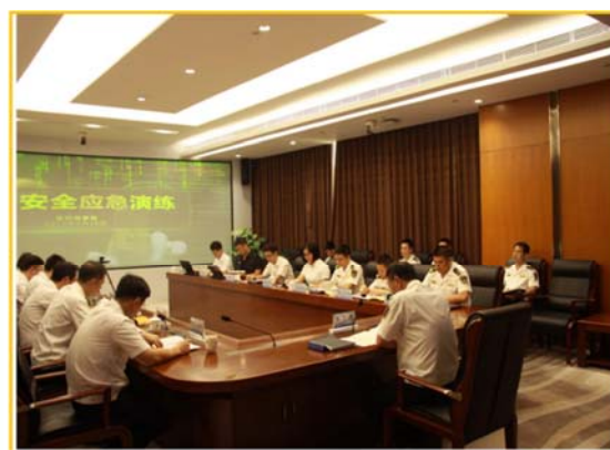
首次模拟实景开展网络安全事件应急处置演练

三是着力加强政府信息队伍能力的培养。2019年，深圳海事局党组理论学习中心组首次开展网络安全专题（扩大）学习，全面提升领导干部信息安全管理意识，强化网络安全责任；组织