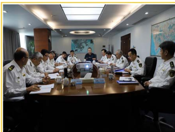
局党组理论学习中心组开展网络安全专题学习

开展信息化知识更新培训、新版门户网站功能测试培训动员会，系统强化岗位主管业务能力和水平。