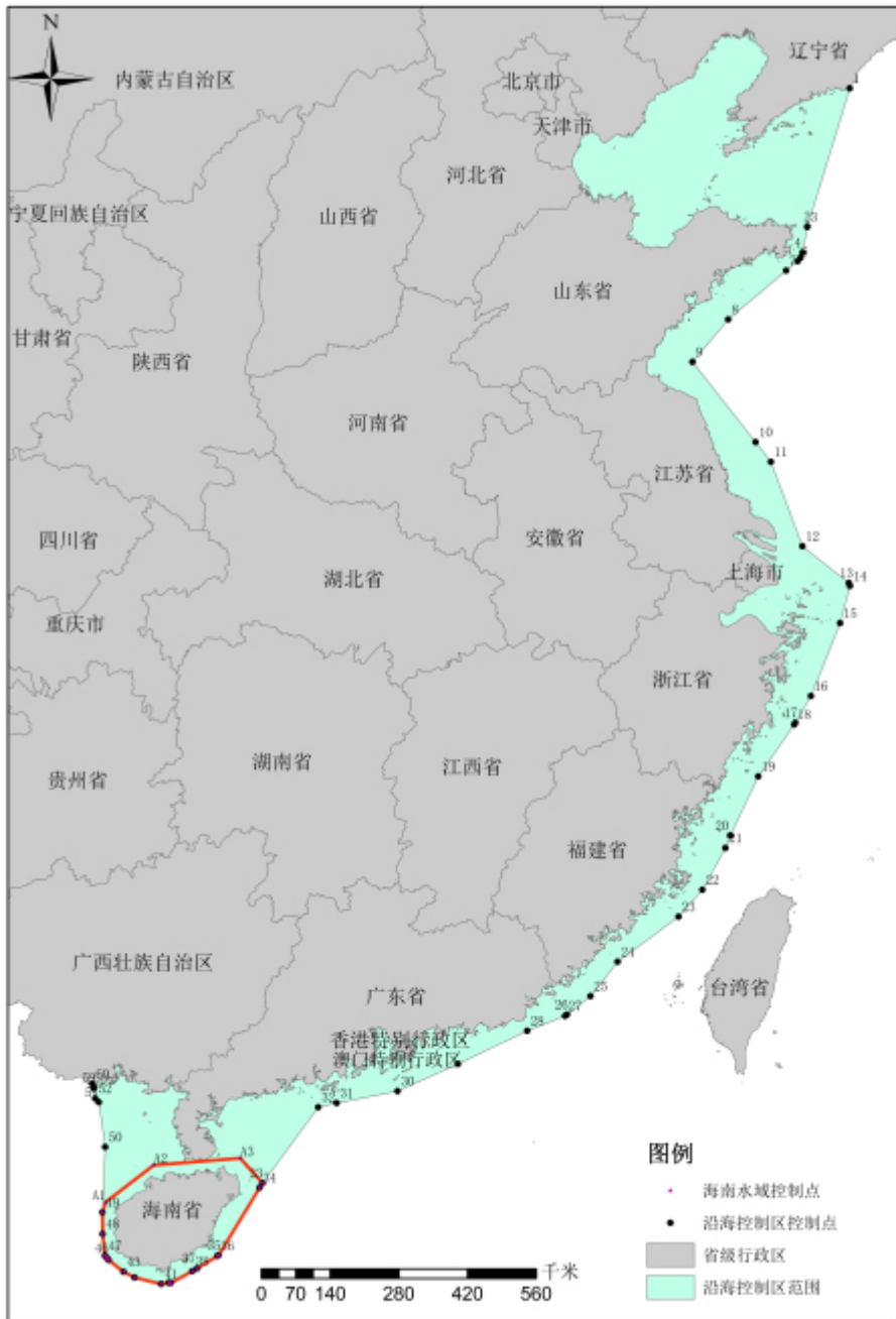
图 1 沿海控制区范围示意图